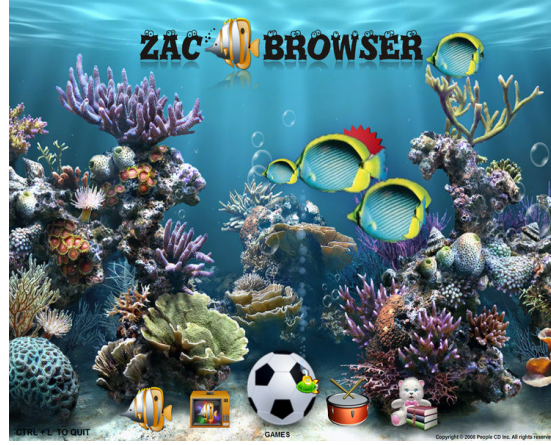
شكل (1): واجهة متصفح زاك

قد قمت بتجربة متصفح زاك على بعض الأطفال التوحديين , فكانت النتيجة أنهم تفاعلوا مع هذا المتصفح وقضوا وقتاً أطول في تصفح واكتشاف محتوياته, و جذبتهم الصور والأيقونات الموجودة فيه و كان البعض يحاولون لمسها بأيديهم. بينما كانوا في السابق يعانون من صعوبة في استخدام المتصفحات العادية المشهورة, حيث كانت هذه المتصفحات تصيبهم بالتشتت وعدم التركيز [شكل (2)].