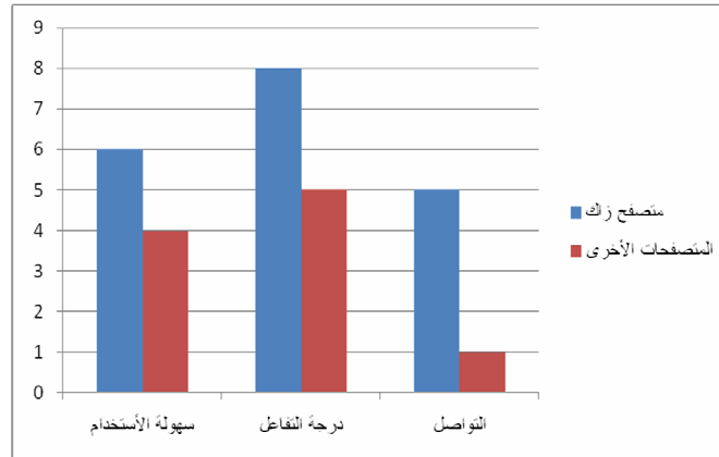
شكل (2): رسم بياني يوضح نتيجة تجربتي لمتصفح زاك على بعض الأطفال التوحديين والفرق بينه وبين المتصفحات الأخرى