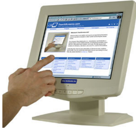
شكل (4) : شاشة اللمس Touch Screen

وتمثل هذه الشاشات فائدة كبيرة للأطفال التوحيدين, حيث أنها تسهل على الطفل التوحيدي التصفح والتعامل مع البرمجيات والتفاعل معها بشكل أكبر [شكل (4)].